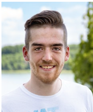
Tjade Fulda Listenplatz 6